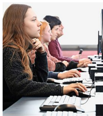
Lernende am Programmieren.

«Grundsätzlich geht es darum, den Teilnehmenden ein Gefühl für digitale Möglichkeiten im Geschäftsumfeld zu vermitteln», sagt Schaub. Die Lernenden sind nach den zwei Tagen natürlich keine Programmierprofis. «Aber